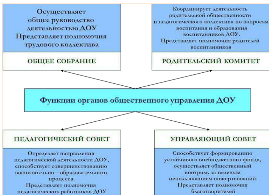
Рисунок 2 – Функции органов общественного управления в ДОУ.

Учитывая возросший объем работы по обеспечению безопасности ОУ, по пожарной, радиационной и экологической безопасности, охране труда, гражданской обороне и др., а также во исполнение протокольного решения Национального антитеррористического комитета и решения заседания Правительственной комиссии по предупреждению и ликвидации чрезвычайных ситуаций и обеспечению пожарной безопасности с целью улучшения организации работы по укреплению комплексной безопасности объектов образования в 2023 году в штатное расписание МБ ДОУ №15 была введена должность заместителя заведующего по безопасности.