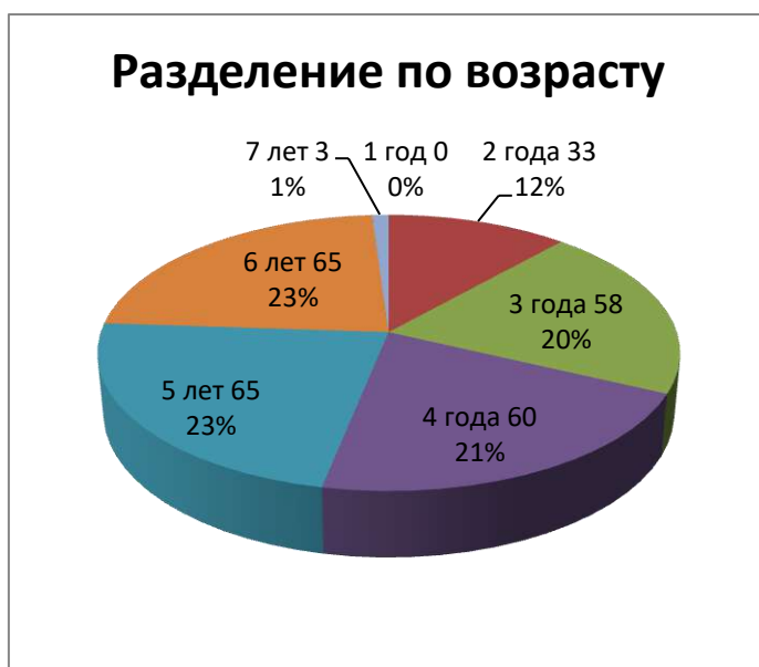
Рисунок 4 – Состав воспитанников МБ ДОУ №1