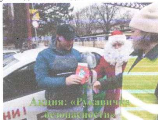
Акция: «Рукавичка безопасности»