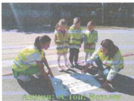
Акция: «Стоп! Возьми ребёнка за руку!»

Неотъемлемой частью взаимодействия являются законные представители детей (родители), Родительский патруль активно участвовал на протяжении всего учебного года в рейдах «Безопасный путь в детский сад»: