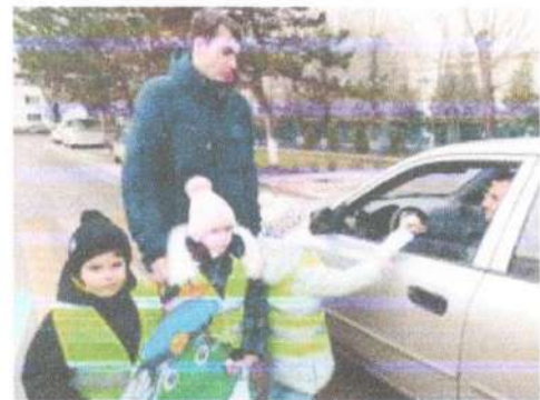
Акція: «В Новый год без ДТП»