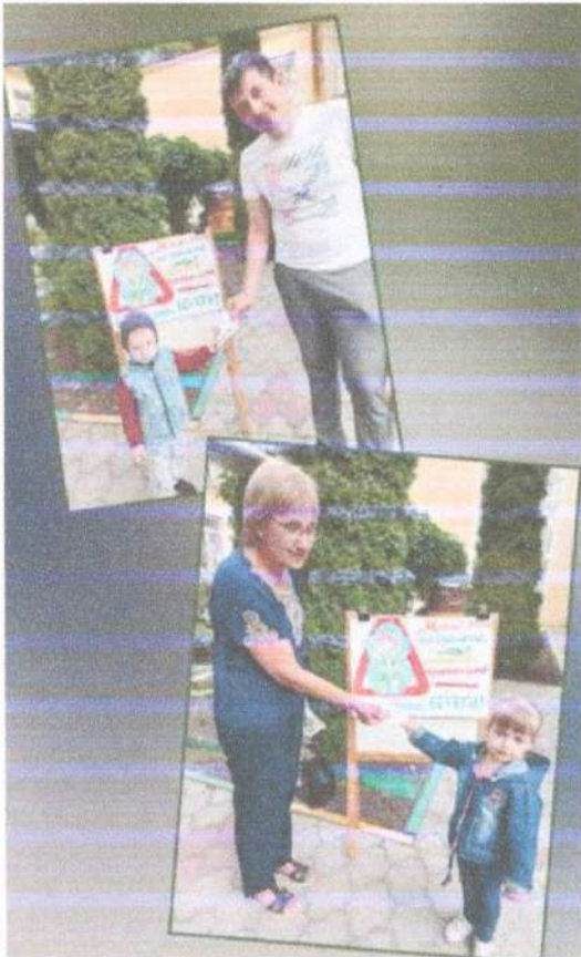
Акция: «Мама, папа не спешите, меня сначала, пристигните!»