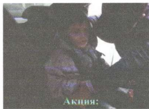
Акция: «Пристегни малыша!»