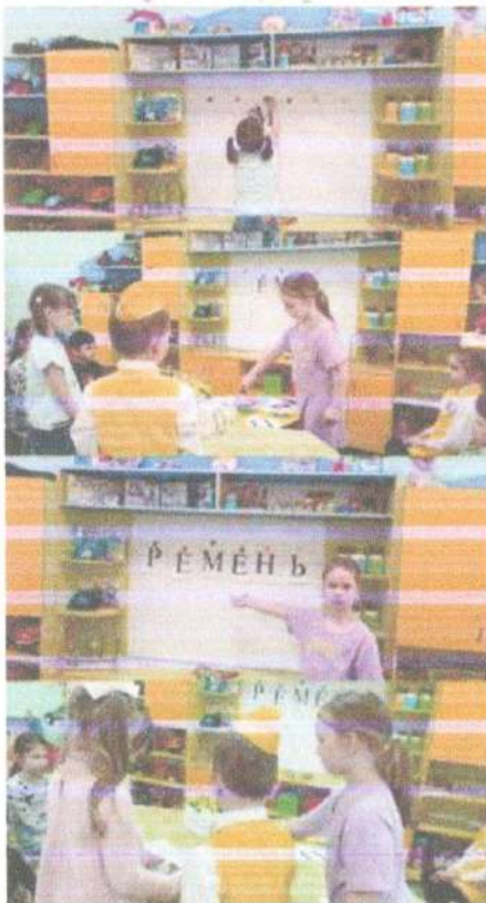
Интеллектуальная игра «Поле чудес»