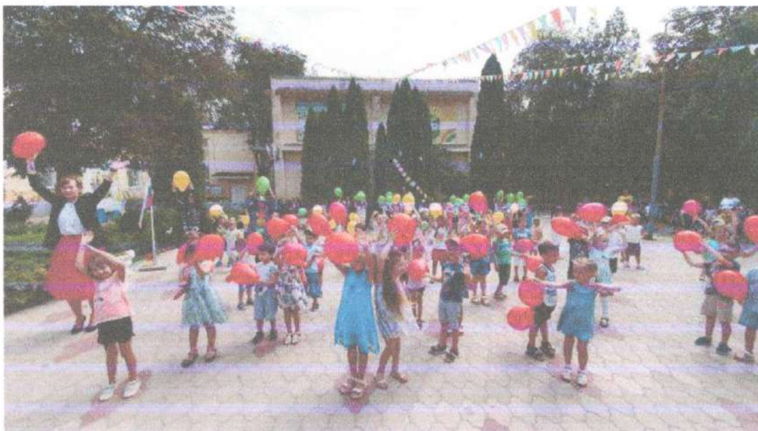
Ярко отметили праздник «День Донского фликера» с привлечением отряда ЮИД «Зебра» МБОУ СОШ №8