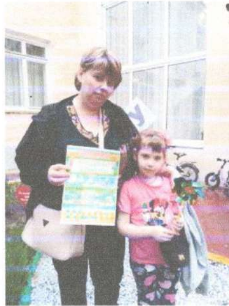
Акция: «Лето близко, на самокат и велосипед без риска»