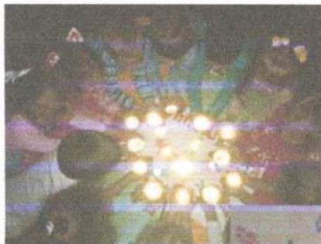
Акция: «Засветись в темноте!»