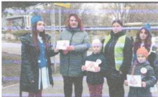
Акція: «Ребенок – главный пассажир!»