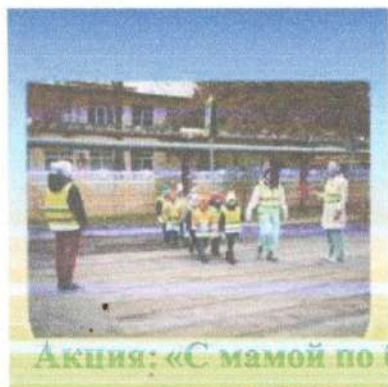
Акция: «С мамой по безопасной дороге»