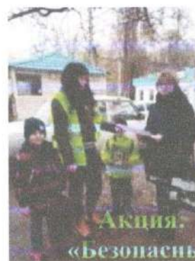
Акция: «Безопасные зимние дороги»

Совместное участие детей и родителей в викторине по ПДД «Правила дорожного движения достойно уважения»