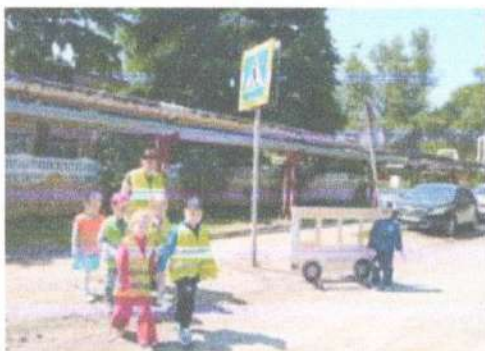
Акция: «Шагающий автобус»