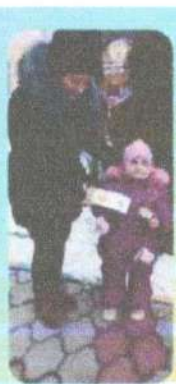
Акция: «Юный безопасный пешеход»