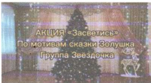
АКЦИЯ «Засветись» По мотивам сказки Золушка Группа Звездочка