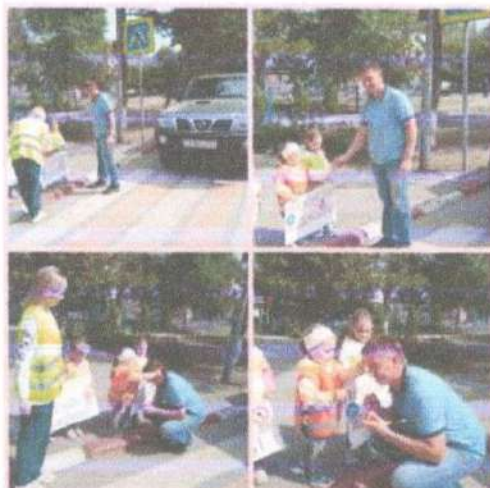
Акция: «Будь вежливым на дороге!»

За этот учебный год с дошкольниками был организован и проведён цикл интегрированной образовательной деятельности по теме безопасности дорожного движения. Большой акцент уделялся проведению профилактических мероприятий в рамках акций: