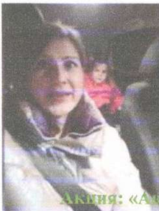
Акция: «Автокресло – детям!»