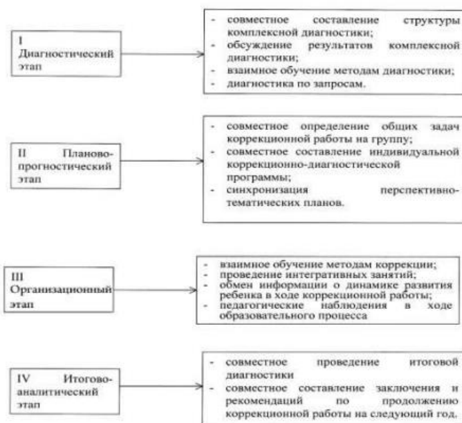
Рисунок 3. Система взаимодействия специалистов в процессе диагностики.

Данные комплексной диагностики каждого воспитанника заносятся в «Карту психолого-педагогического и медико-социального развития ребенка», в которой проектируется разработка Индивидуального коррекционного маршрута развития, в котором систематизируются все наблюдения и рекомендации специалистов, динамика развития ребенка.