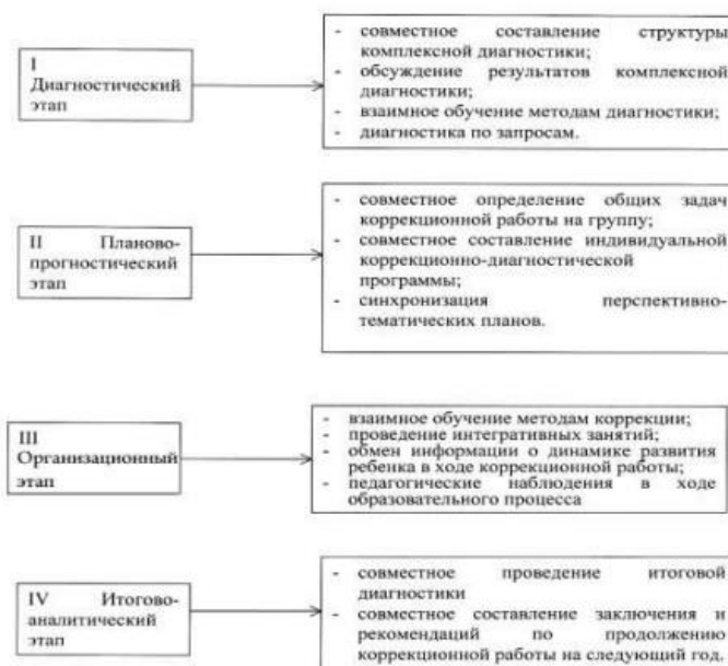
Рисунок 3. Система взаимодействия специалистов в процессе диагностики.

1 этап - Диагностический. Разработана поэтапная система взаимодействия специалистов в процессе диагностики.