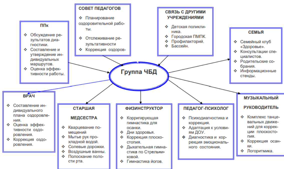
Рисунок 1. Схема организации деятельности с часто болеющими детьми в МБ ДОУ №15

Организация деятельности с часто болеющими детьми в МБ ДОУ № 15