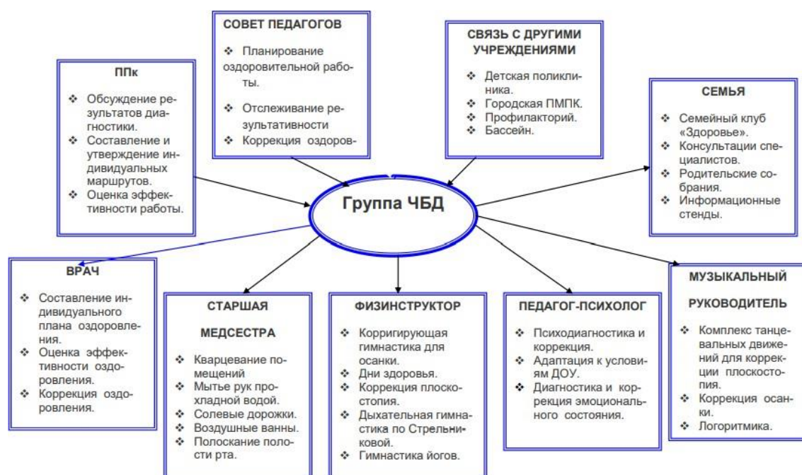
Рисунок 1. Схема организации деятельности с часто болеющими детьми в МБ ДОУ №15