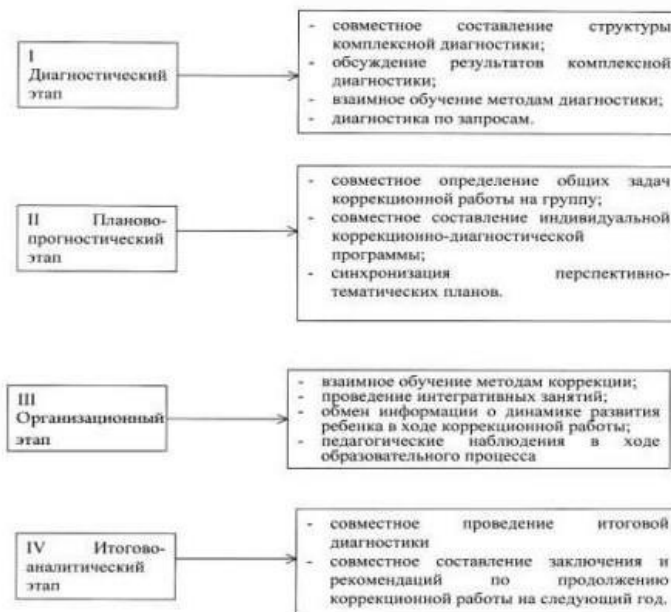
Рисунок 3. Система взаимодействия специалистов в процессе диагностики.

Данные комплексной диагностики каждого воспитанника заносятся в «Карту психолого-педагогического и медико-социального развития ребенка», в которой проектируется разработка Индивидуального коррекционного маршрута развития, в котором систематизируются все наблюдения и рекомендации специалистов, динамика развития ребенка.